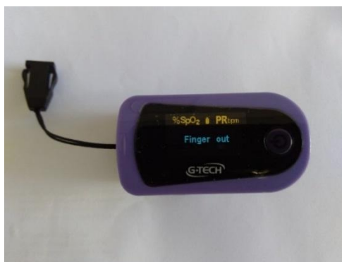
FIGURA 5: Oxímetro de dedo usado para aferição dos dados.

Nos dois grupos foi feita a aferição da saturação de oxigênio e frequência cardíaca com oxímetro de dedo (G-TECH, Modelo Oled graph, Beijing, China) (Figuras 5 e 6) antes e após o acolhimento (início do tratamento), durante o atendimento odontológico e após o término do tratamento.