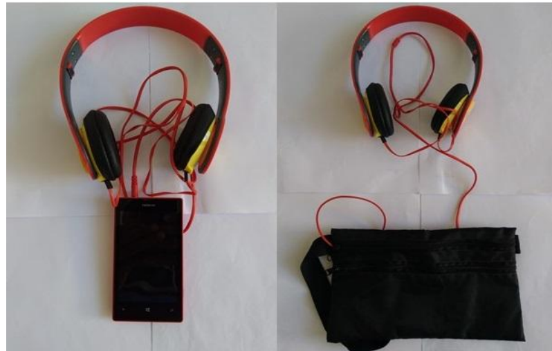
FIGURA 3. Fone de ouvido.