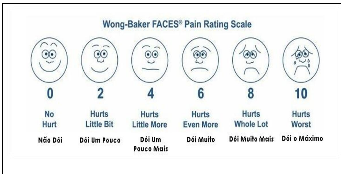
FIGURA 7. Escala de dor Wong Baker Faces, Pain Rating Scale. BUCHANAN et al. , (2002).

Antes do acolhimento e após o término do tratamento foi aplicada a escala de dor (BUCHANAN et al. , 2002). Para aplicação da escala de dor (Figuras 7 e 8) que auxiliou na avaliação da dor, foi feita a orientação para as crianças representarem por meio das imagens na escala o desenho que representava o seu estado de dor no momento do nosso contato. A criança foi orientada a escolher a imagem que representasse como ela se sentia durante os diferentes tempos de avaliação.