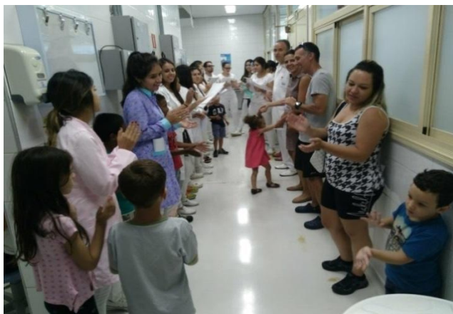
FIGURA 1. Acolhimento com as crianças do grupo experimental.

O acolhimento (Figura 1) foi feito com uma conversa com as crianças na recepção sobre o que seria feito na pesquisa e no tratamento com o dentista. Em seguida, foram tocadas 4 músicas ao vivo com violão de 6 cordas (Menphis São Bernardo do Campo, Brasil) com as crianças, a equipe de profissionais, os pais e/ou responsáveis pelas crianças. Pensando em realizar um acolhimento que não fosse atrapalhar o período da consulta, foram tocadas 4 músicas somando uma média de 10 minutos de acolhimento.