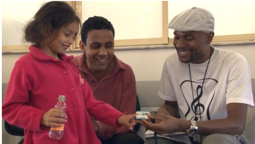
FIGURA 6. Aferição da frequência cardíaca e saturação de oxigênio.

Antes do acolhimento e após o término do tratamento foi aplicada a escala de dor (BUCHANAN et al. , 2002). Para aplicação da escala de dor (Figuras 7 e 8) que auxiliou na avaliação da dor, foi feita a orientação para as crianças representarem por meio das imagens na escala o desenho que representava o seu estado de dor no momento do nosso contato. A criança foi orientada a escolher a imagem que representasse como ela se sentia durante os diferentes tempos de avaliação.