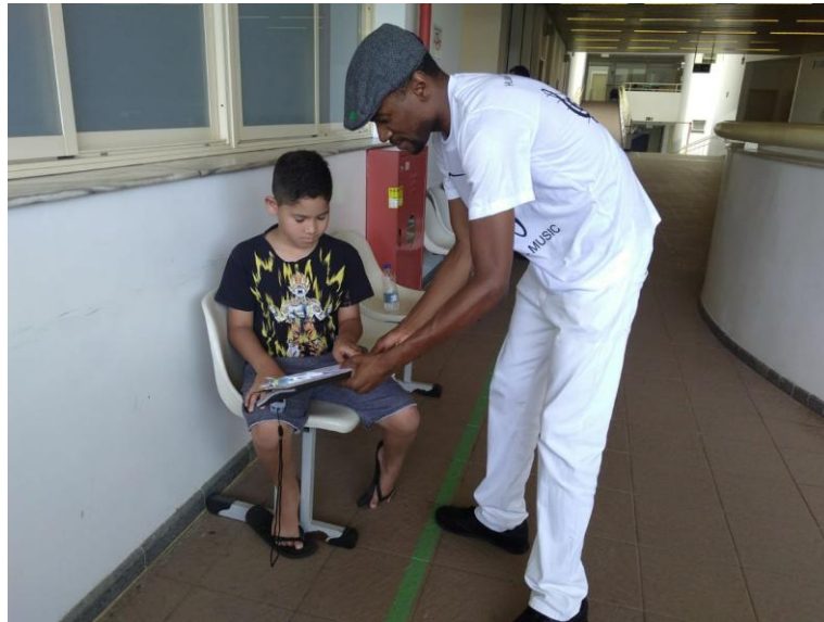
FIGURA 8. Avaliação com a escala de dor.

Para aplicação da escala de ansiedade odontológica de Corah (Corah et al. , 1978 e Hu et al. , 2007) (Quadros 2 e 3) antes do acolhimento e após o término do tratamento, foi feita a orientação para as crianças a responderem às perguntas da escala que correspondessem com seu sentimento (estado) no momento do nosso contato. A criança foi orientada a responder às perguntas conforme o quadro de acordo com a escala de ansiedade de Corah.