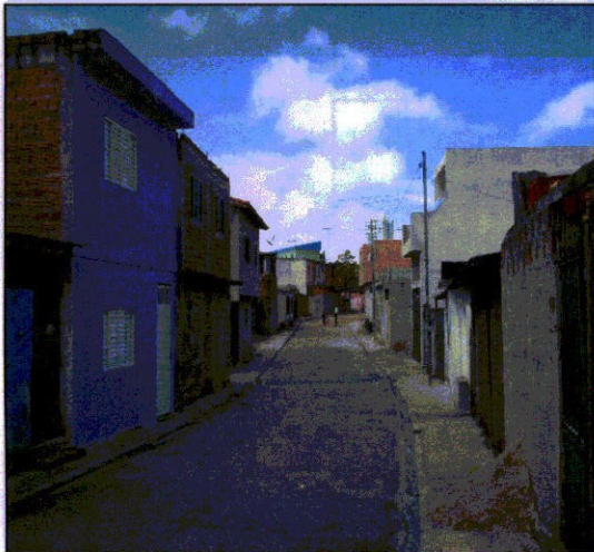
FIGURA 28 - Viela 49 Acesso/ contenção e floreira