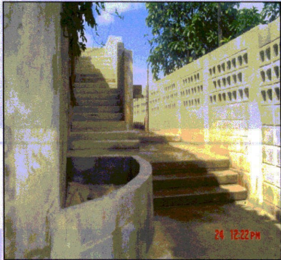
FIGURA 27 - Rua 5 Contenção/ autoconstrução