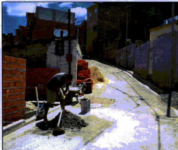
FIGURAS 29 e 30 - Rua 7: Autoconstrução/ reforma