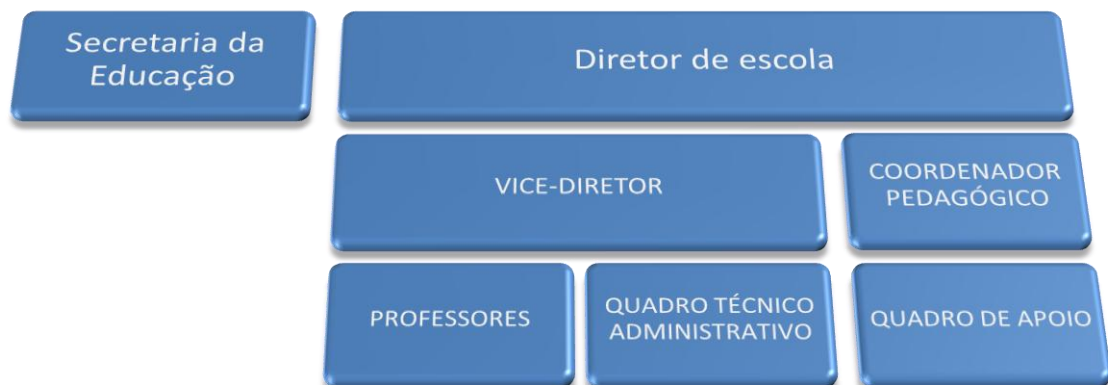
FIGURA 3 – Organograma da equipe escolar

As escolas do Ensino Fundamental apresentam uma boa infraestrutura, com salas de informática, bibliotecas com renovação anual de livros, quadras cobertas, refeitórios, lousa digital, cursos de aperfeiçoamento anual e materiais pedagógicos. No final de 2011, a Secretaria de Educação adquiriu 245 notebooks para os alunos e cada escola possui, no mínimo, 30 notebooks para que possam ser utilizados em sala de aula.