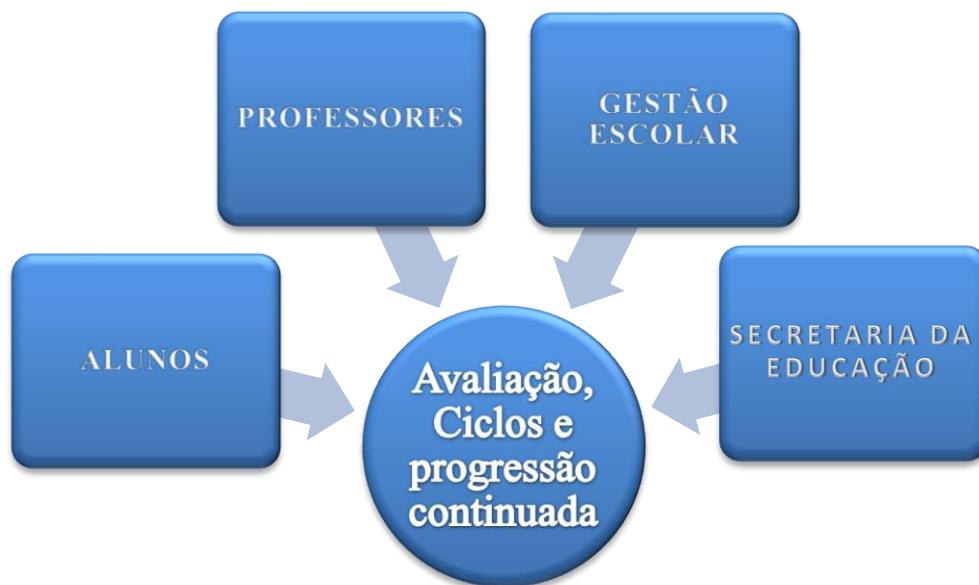
FIGURA 2 - Relação entre avaliação, ciclos e progressão continuada e públicos da escola

Organizamos as perguntas do questionário aplicado à comunidade escolar em três eixos de análise. O primeiro, “conceitos e concepções”, é um eixo no qual os participantes explicitam suas considerações a respeito dos ciclos e da progressão continuada; o segundo, “gestão”, é um eixo no qual iremos observar como a gestão tem atuado nas questões da avaliação no ambiente escolar. E no último eixo, “procedimentos de avaliação”, mapeamos as concepções dos participantes sobre a prática avaliativa. Definidos os eixos, cada questão foi analisada, considerando os aspectos teóricos que embasaram a presente pesquisa, por