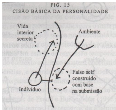
Figura acima foi extraída do livro Da Pediatria à Psicanálise: Obras escolhidas (D. W. Winnicott, 1953a [1952], p. 310)

A figura acima é surge no texto “Psicose e Cuidados Maternos” e representa a ruptura no conjunto ambiente-indivíduo ocasionado pelas sucessivas intrusões do ambiente em suas falhas de adaptação e atendimento às necessidades do bebê e a conseqüente reação do indivíduo. Winnicott afirma que tais fracassos levam a uma cisão e, “nos casos extremos de cisão, a vida interior secreta terá muito pouco do que pertence a realidade externa” (1953a [1952], p. 311). Como conseqüência, uma vida falsa ocupa o lugar do self verdadeiro. O self verdadeiro isolado e incomunicável passa a ser defendido por um falso self aquiescente e este, que foi “desenvolvido com base da submissão, não pode candidatar-se à independência da maturidade, salvo quem sabe, a uma pseudomaturidade num ambiente psicótico” (p. 312).