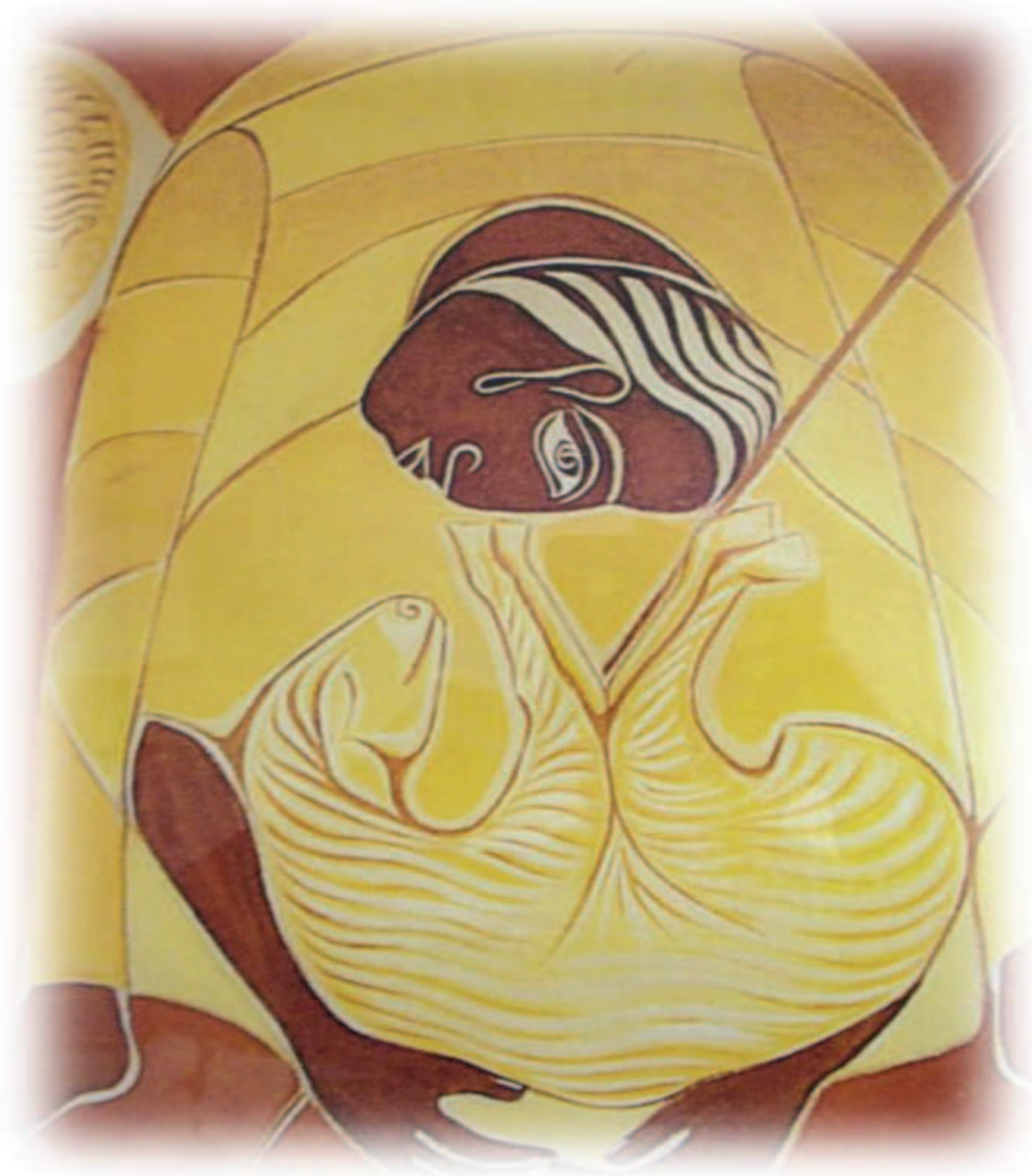
Cláudio Pasto. Pintura sobre lonita. Adveniat. Essen. Alemanha. 1987

“Quem dentre vós que, tendo cem ovelhas e perdendo uma delas, não deixa as noventa e nove no deserto, e vai em busca da que se perdeu, até encontrá-la?” (Lc 15,4)