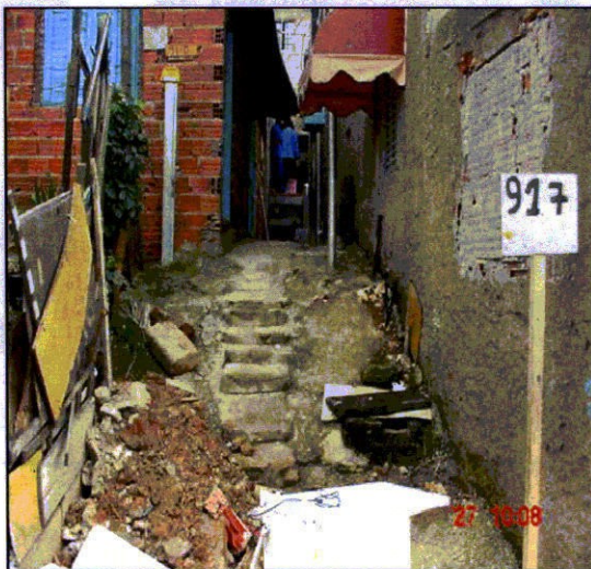
FIGURAS 10 e 11- Barracos e vielas