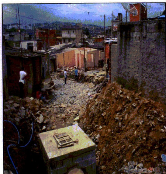
FIGURA 25 - Rua 6: Demolição/ limpeza/ infra-estrutura