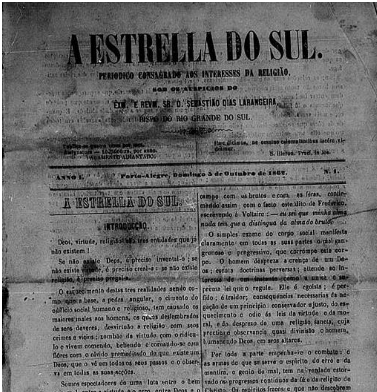
Figura 5. A Estrella do Sul, n. 1, 5 de outubro de 1862, p. 1. Porto Alegre (RS).