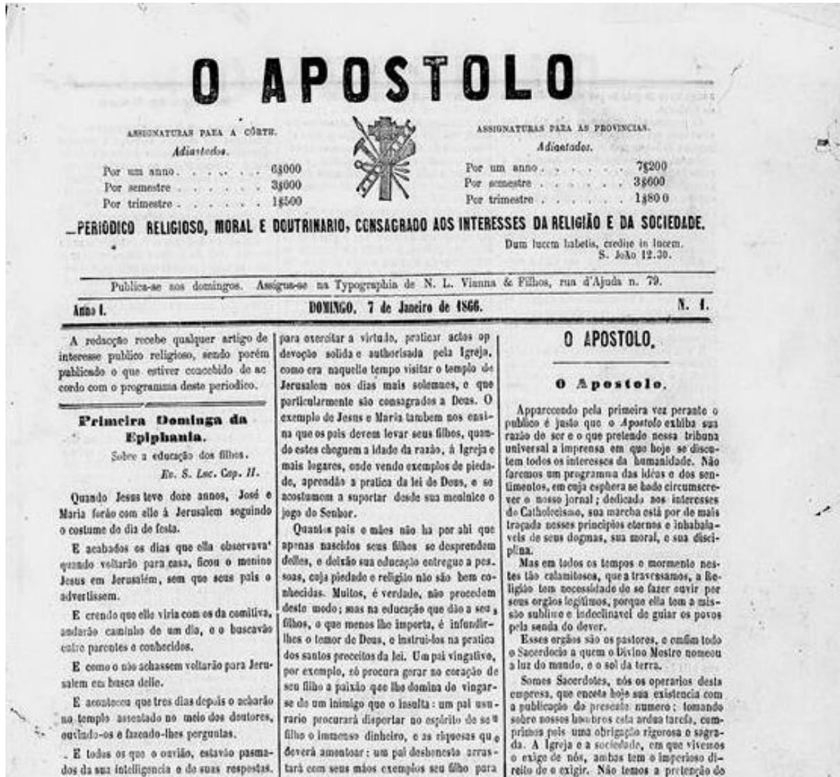
Figura 1. O Apóstolo, n. 1, 7 de janeiro de 1866, p. 1. Rio de Janeiro (RJ).