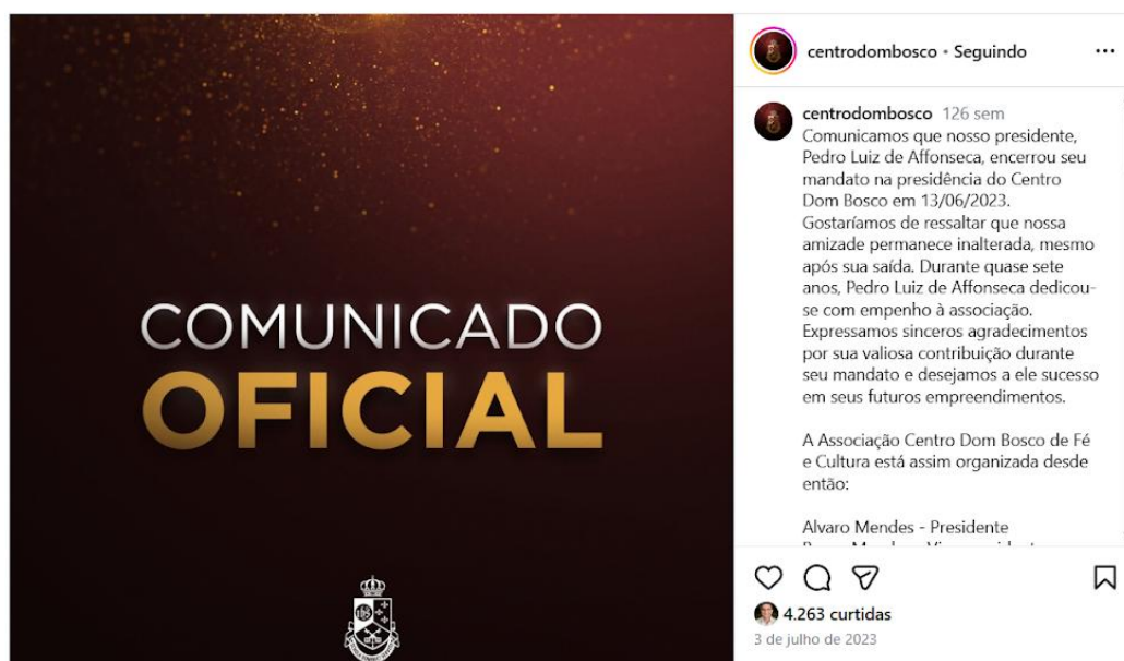
Figura 2: Comunicado oficial sobre o desligamento de Pedro Affonseca do CDB