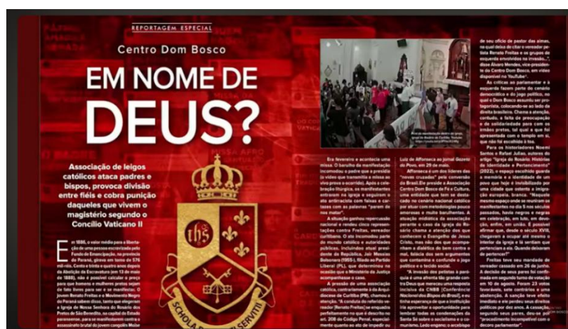
Figura 5: Print do momento em que o CDB mostra a entrevista publicada em uma revista