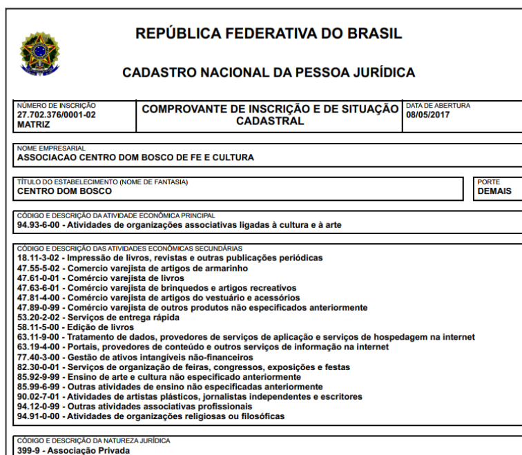
Figura 1: Print da disponibilização dos serviços da associação a partir do CNPJ