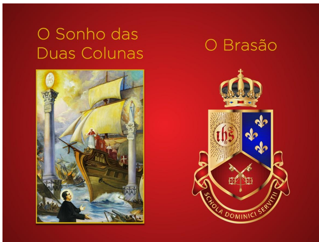
Figura 3: Representação do sonho de Dom Bosco e o brasão do CDB