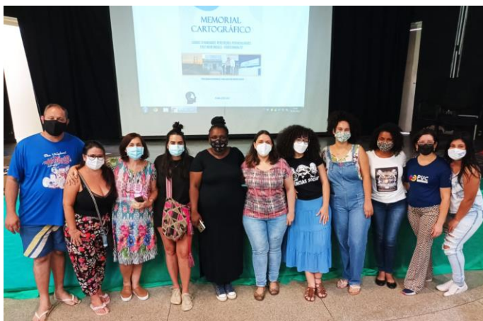
Figura 4 - Encontro Presencial na escola EMEF Dayla Cristina Jardim Santiago

A figura 3, a seguir, mostra o encontro presencial realizado no dia 4 de dezembro de 2021, na escola EMEF Dayla Cristina Jardim Santiago, onde foram apresentados o memorial cartográfico e as atividades realizadas pelo projeto Vínculos.