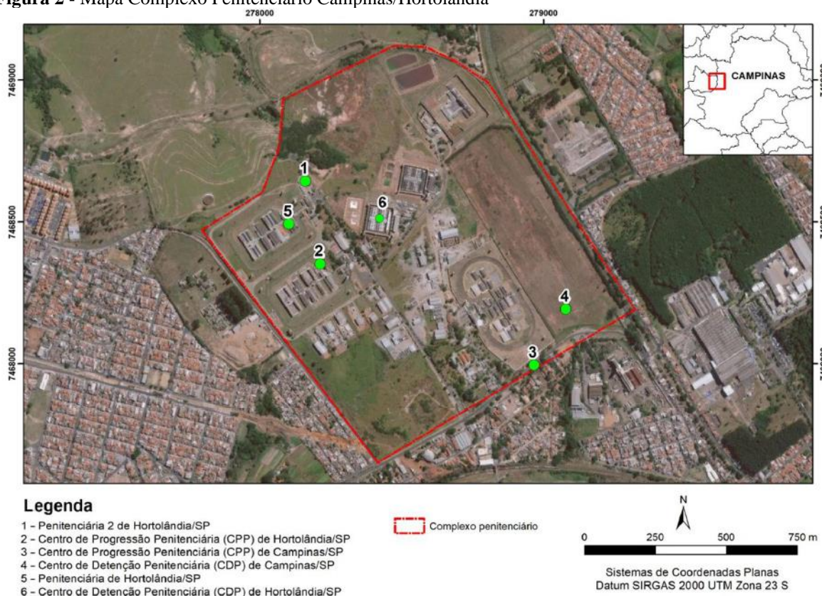
Figura 2 - Mapa Complexo Penitenciário Campinas/Hortolândia