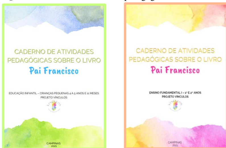
Figura 5 – Cadernos de atividades pedagógicas sobre o livro Pai Francisco

Pode-se dizer que o presente trabalho de extensão utilizou também da arte como uma ferramenta interventiva, na elaboração do caderno com propostas de atividades lúdicas sendo um para Educação Infantil 15 e outro para primeiro e segundo ano do Ensino Fundamental 16 , baseado no livro Pai Francisco da autora Marina Miyazaki, abordando temas relacionados ao preconceito que afetas familiares de pessoas de privação de liberdade. Segue a imagem das capas dos cadernos pedagógicos.