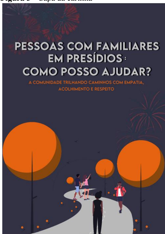
Figura 3 - Capa da cartilha