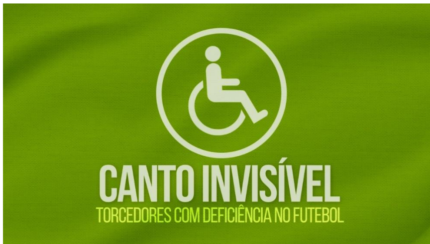
Figura 1: Logotipo do projeto